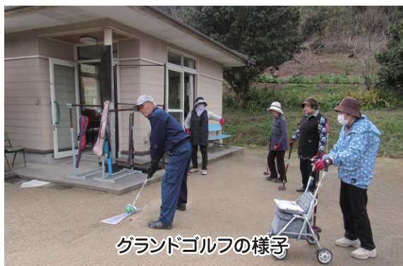
グランドゴルフの様子