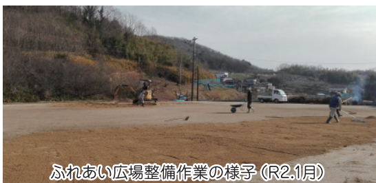
ふれあい広場整備作業の様子 (R2.1月)

グラウンド・ゴルフをしている「ふれあい広場」の整備をしました。健康のために一緒にしませんか。(毎週月、土9時～)