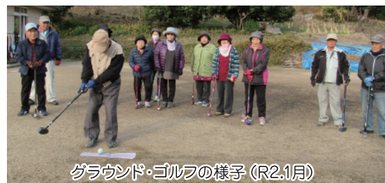
グラウンド・ゴルフの様子 (R2.1月)