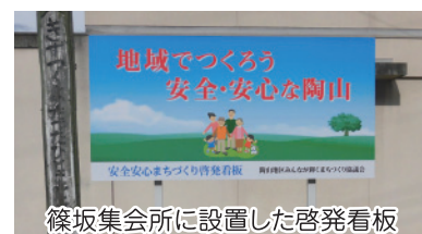
篠坂集会所に設置した啓発看板

安全安心を啓発する看板の図案募集に協力いただきありがとうございました。入田、篠坂、押撫、有田地区の4箇所に看板を設置しました。引き続き、地域の災害及び交通安全など危険箇所を調査し、危険標識の設置及び安全安心マップ作りに取り組んでいます。