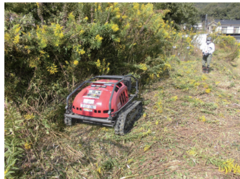
リモコン式草刈り機で荒地の草刈り実施 (笠岡市から借用できます)