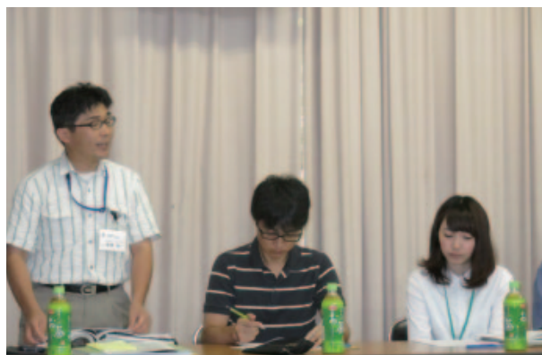
笠岡市担当職員による説明