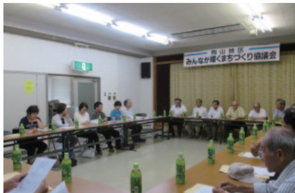
慎重に協議する代議員の皆様